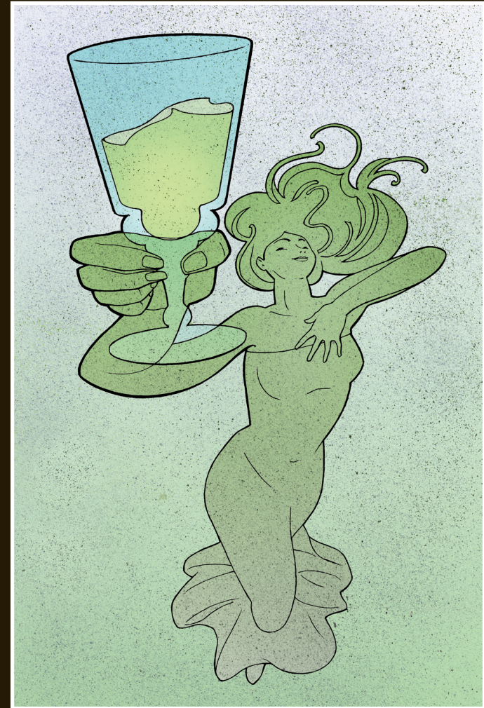
LA FÉE VERTE : DESSINATEUR PIERRE-YVES VIDELIER - 2016

SAMEDI 1 ER ET DIMANCHE 2 OCTOBRE 2016 PONTARLIER